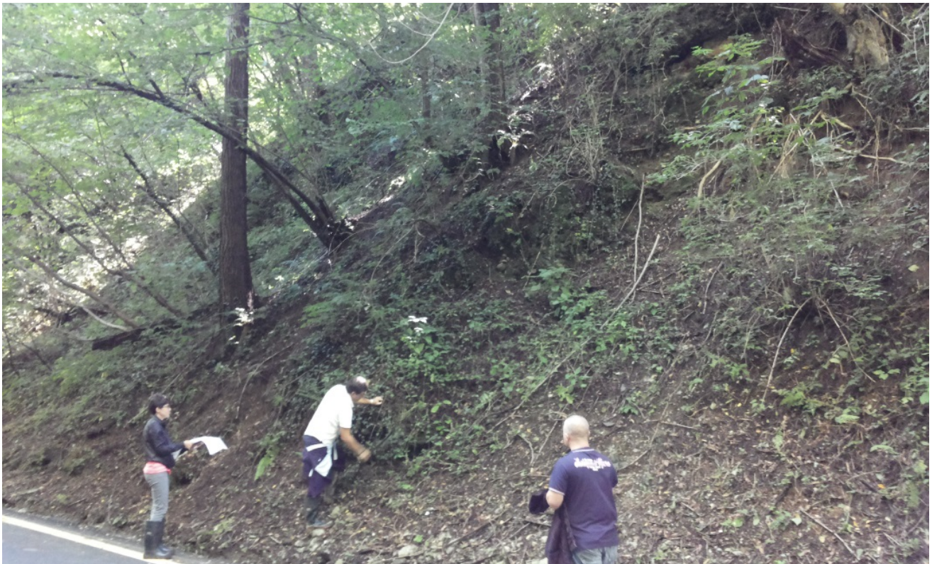
Foto 26 - Parete di conglomerato da stabilizzare con reti in aderenza.