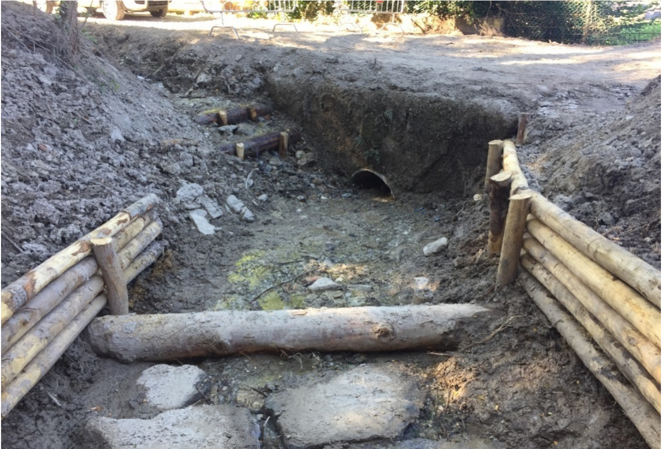
Foto 28 - Ponte di via della Fratellanza.