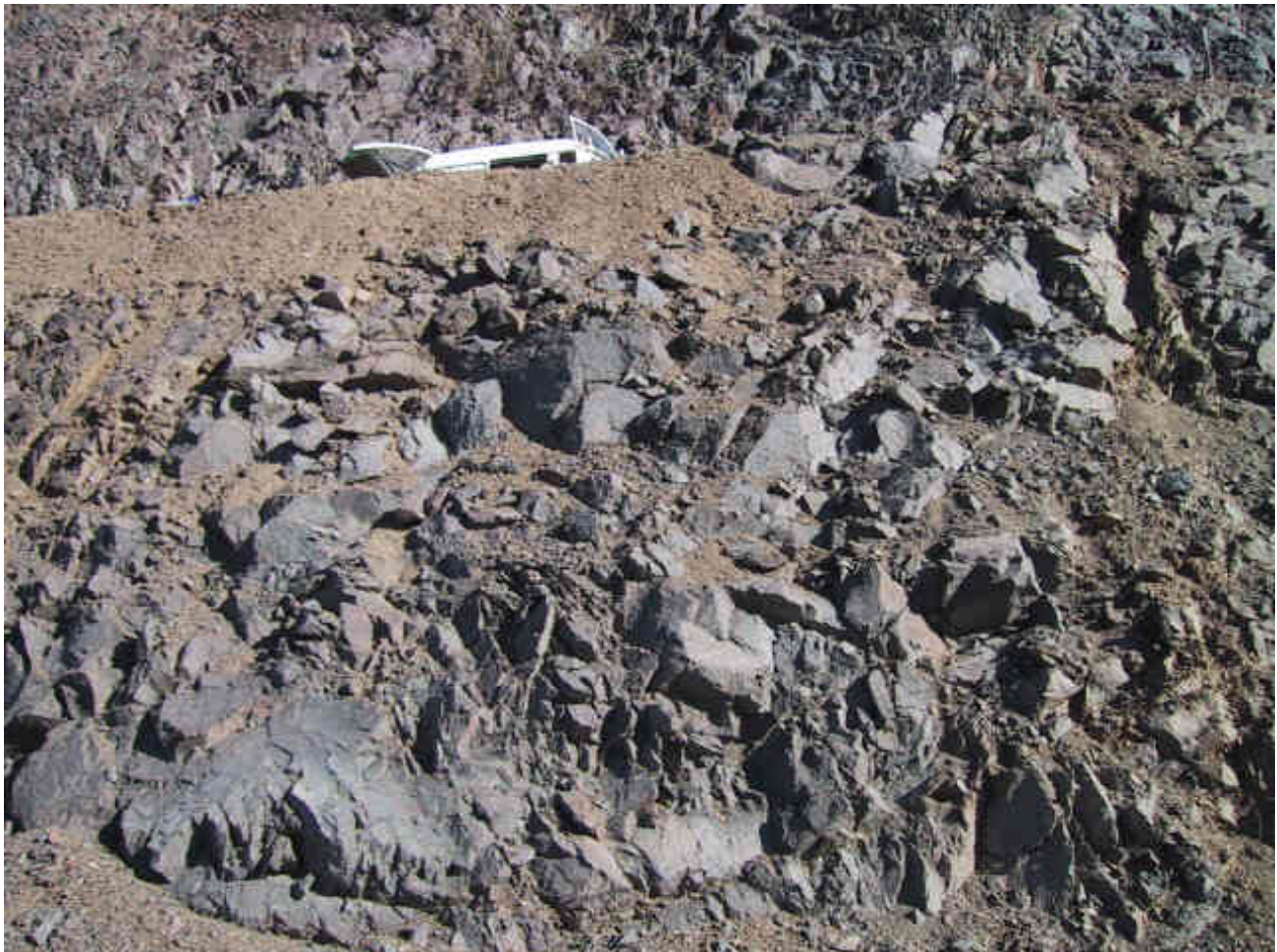
Foto 3 - Affioramenti di porfirite.