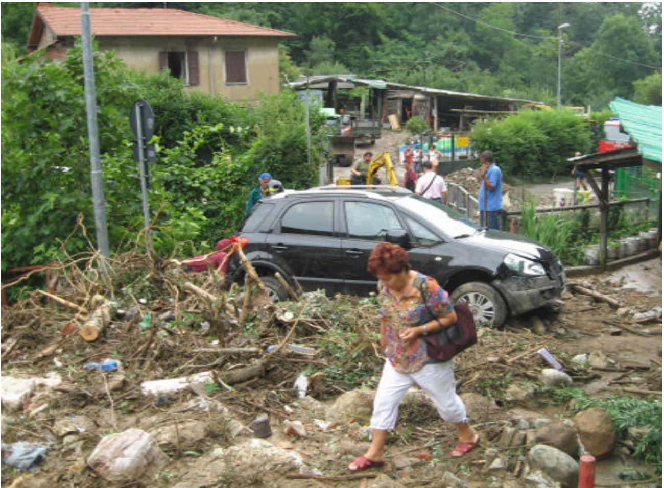
Foto 12 - Ponte interessato dal fenomeno franoso.