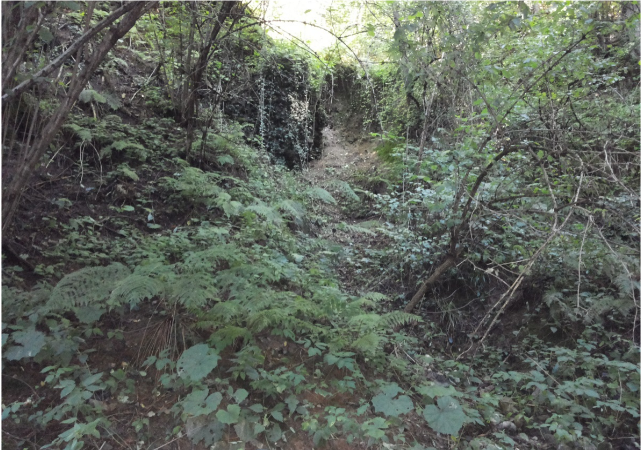
Foto 25 - Tipico ruscellamento con affioramenti di conglomerato del Ceppo dell'Olona, spesso instabili.