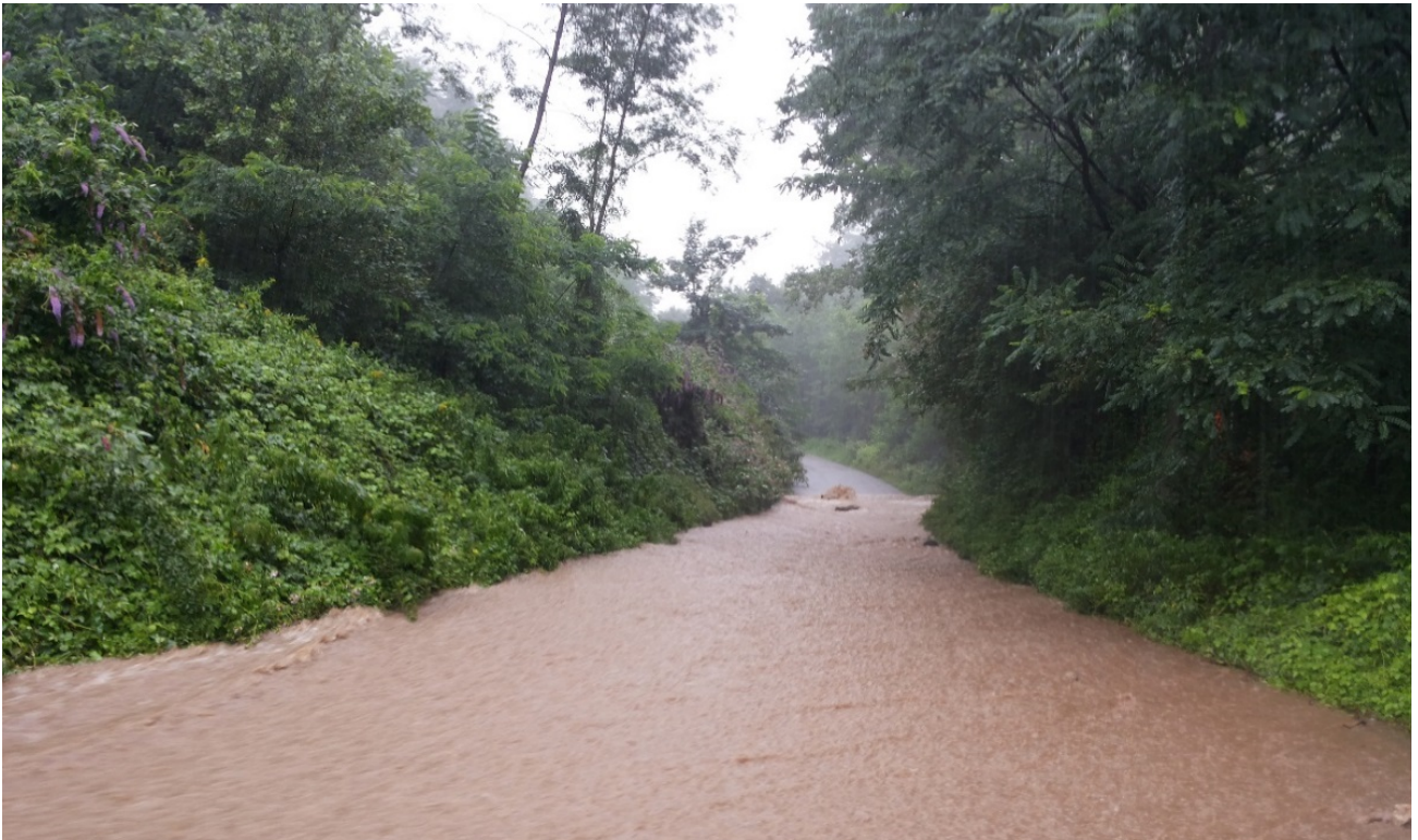
Foto 17 - Via Monte Nero durante gli eventi di piena.