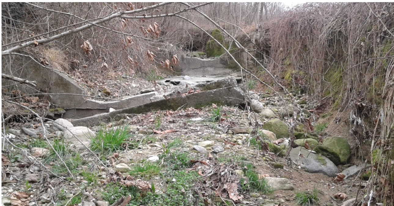
Foto 19 - Torrente Volturmo, briglie in calcestruzzo distrutte.

Considerate le condizioni dei bacini dei due sistemi vallivi è necessario attivare un monitoraggio periodico (semestrale), di verifica della funzionalità idraulica dei tombotti e della stabilità dei versanti.