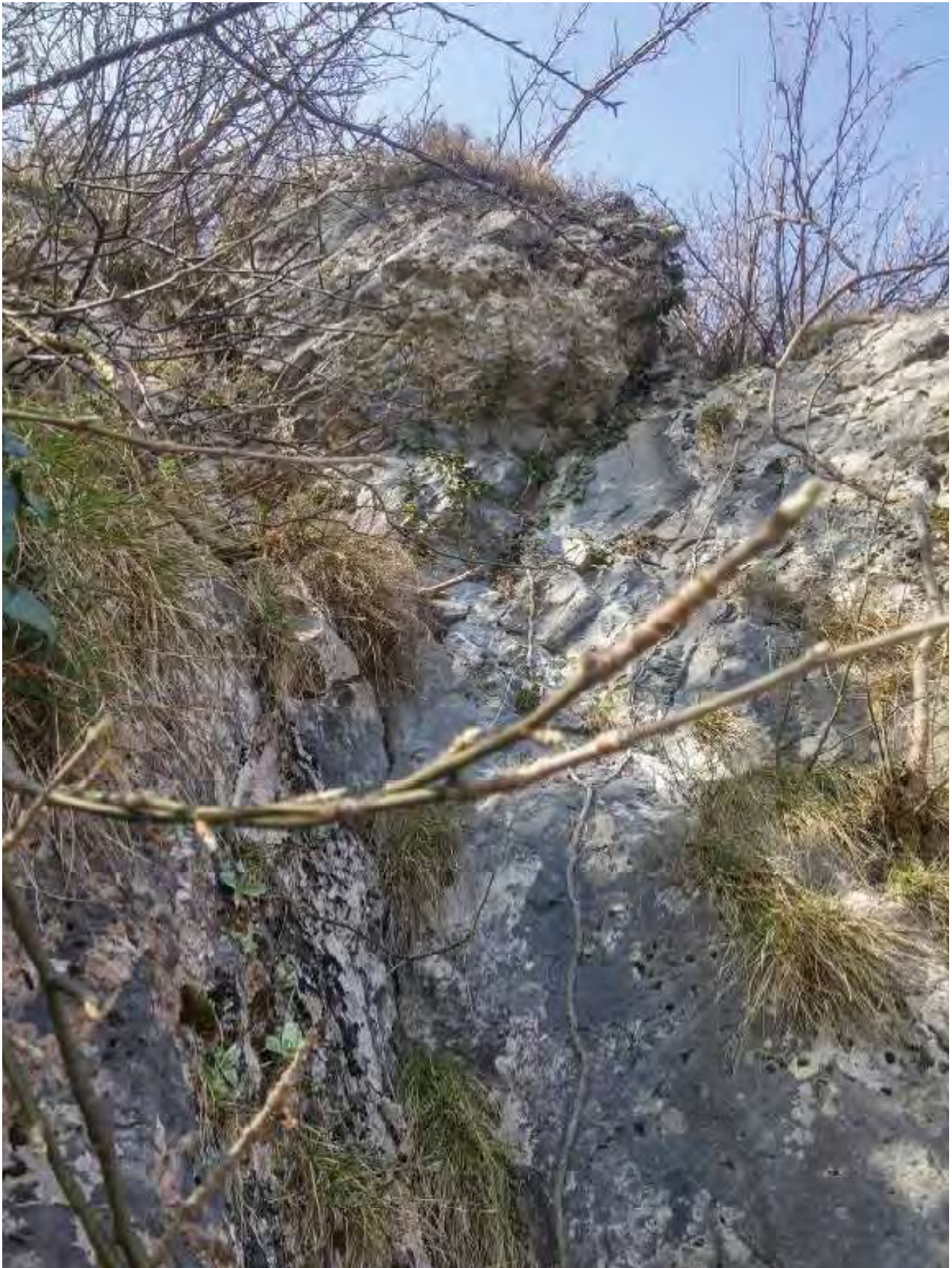
Foto 8 - Versante e ammassi rocciosi non protetti.