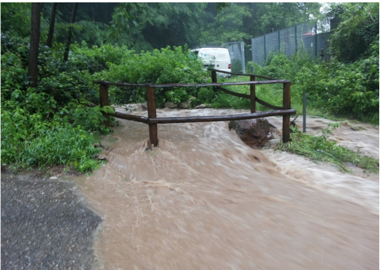
Foto 18 - Struttura idraulica insufficiente nei momenti di piena.