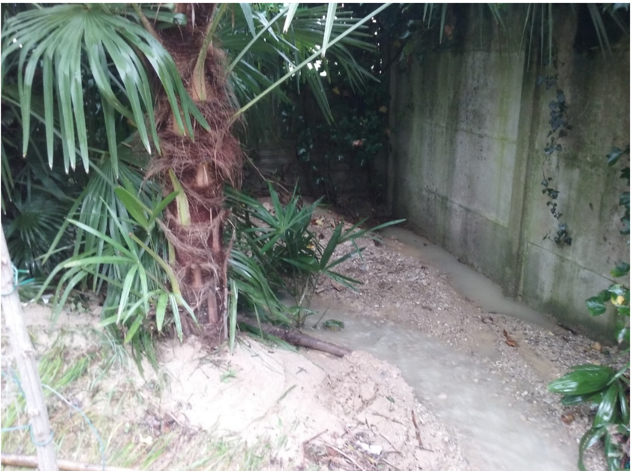
Foto 15 - Interramento tombotto terminale che conduce le acque al lago e spagliamento acque.