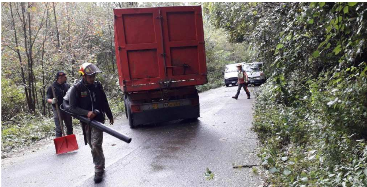
Foto 23 – Intervento di ripristino della percorribilità stradale.

Le problematiche di stabilità investono anche le piante presenti sul versante che spesso cadono sulla strada. Il sedime stradale è interessato anche da fenomeni di ruscellamento e detriti.