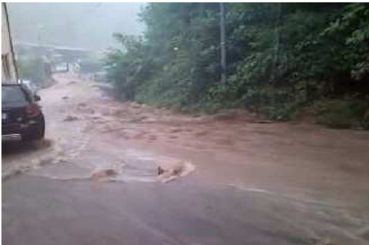
Foto 11 - Via Mulini Grassi, durante le forti precipitazioni.

Nell'impluvio del Torrente Silvana, si possono generare fenomeni di debris flow, dovuti ai flussi di acqua provenienti dall'intera via Mulini Grassi, per l'assenza di un'adeguata rete di drenaggio superficiale delle acque. Inoltre la via Mulini Grassi è delimitata dal muro del parco comunale di Villa Toeplitz, dietro il quale si accumulano le acque meteoriche. Questa struttura muraria ha subito più volte fenomeni di crollo e conseguente inondazione della strada. La quantità d'acqua che si riversa nel piccolo impluvio del Torrente Silvana, produce fenomeni di erosione e conseguente trasporto di materiale solido a valle. L'impluvio è stato sistemato con la formazione di briglie atte a contenere il trasporto di materiale, ma permangono le problematiche a monte. L'impluvio si collega al Fiume Olona tramite un tombotto che in condizioni critiche, non è in grado di garantire la sicurezza idraulica del sistema. Per la riduzione del rischio, è necessario prevedere la formazione della rete fognaria delle acque bianche lungo la via Mulini Grassi. Sarà necessario realizzare presidi di guardia nelle aree retrostanti il muro di Villa Toeplitz e verificare lo stato manutentivo delle briglie esistenti. Il 25 Luglio 2009 sulla via Mulini Grassi è avvenuto un importante fenomeno di debris flow che ha coinvolto anche alcuni veicoli.