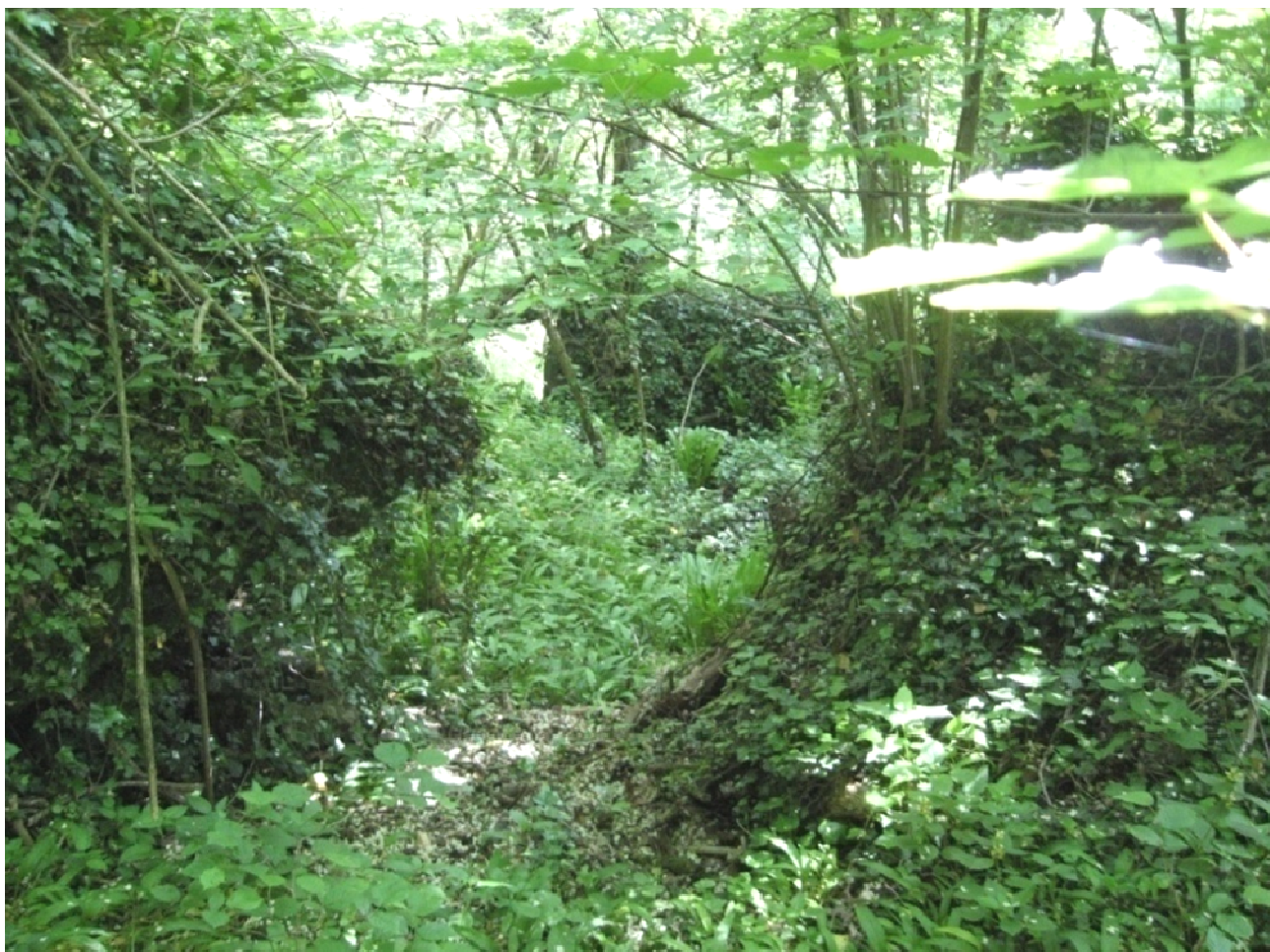
Foto 21 - Massi crollati sul versante, ormai completamente ricoperti dalla vegetazione.

Versante molto acclive costituito dai conglomerati del ceppo dell'Olona nella parte sommitale. Nella parte sottostante, il versante presenta forme più dolci ed è costituito da corpi prevalentemente argillosi. La parte alta è di fatto permeabile e quindi a metà versante si hanno notevoli emergenze idriche. Il terreno è caratterizzato dalla presenza di numerosi blocchi di conglomerato distaccatisi dalle pareti e pertanto soggetto a crollo massi e a lento arretramento del ciglio. Nel tempo occorre verificare l'erosione del versante e l'arretramento del ciglio e provvedere a stabilizzare le porzioni soggette al fenomeno di crollo di corpi conglomeratici. La chiesa di Sant'Evasio, che poggia direttamente sui conglomerati del Ceppo dell'Olona, presenta fratturazioni nelle pareti e nelle volte che devono essere controllate e verificate. Le pareti verticali conglomeratiche sottostanti la chiesa sono protette da reti paramassi in aderenza. L'area deve essere sottoposta a monitoraggio periodico (annuale), finalizzato all'analisi di nuovi crolli di corpi conglomeratici e allo studio della dinamica geomorfologica di versante. La frana di scivolamento del 19 Settembre 2021, dovuta ad intense precipitazioni, ha interessato depositi di copertura del conglomerato del Ceppo dell'Olona, rendendo completamente inagibile la via Cervinia.