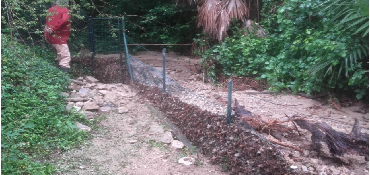
Foto 14 - Interramento del tombotto e del collettore, oltre la rete metallica è presente una griglia (tombotto a monte).