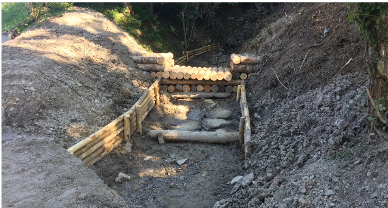
Foto 27 - Briglia di presidio realizzata a monte del ponte.

Lo stesso non può rimanere isolato, ma si dovrà concretizzare un intervento di sistemazione complessiva del bacino e dell'asta dell'intero reticolo idrografico che presenta numerose frane e smottamenti. Si dovrà inoltre, provvedere al rifacimento del ponte di via della Fratellanza.