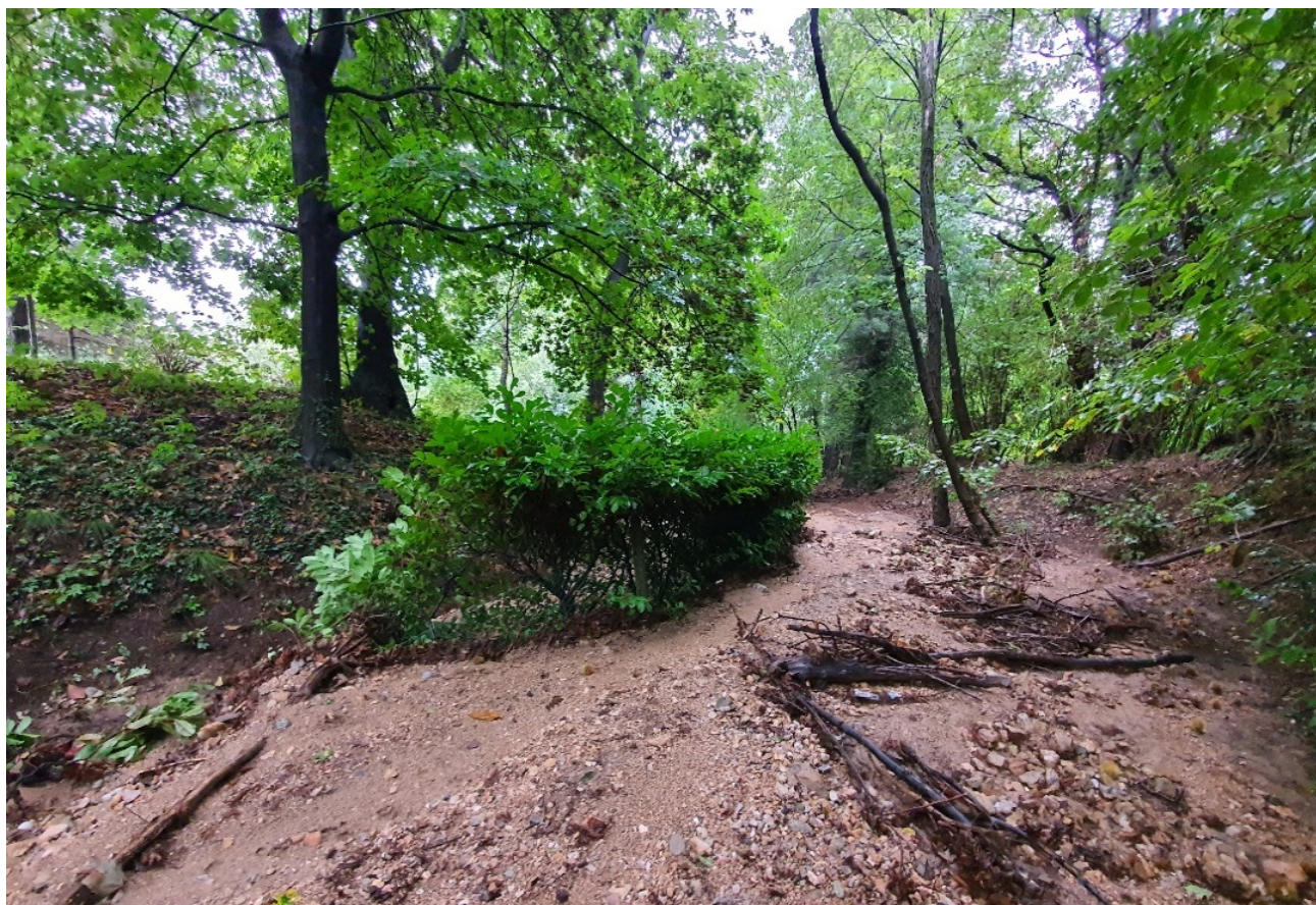
Foto 9 - Accumuli detritici - sovralluvionamento.

A seguito degli eventi sono state realizzate lungo l'alveo otto briglie di contenimento del fenomeno di trasporto solido che, durante l'evento del 29 Settembre 2020, hanno protetto l'abitato di Velate.