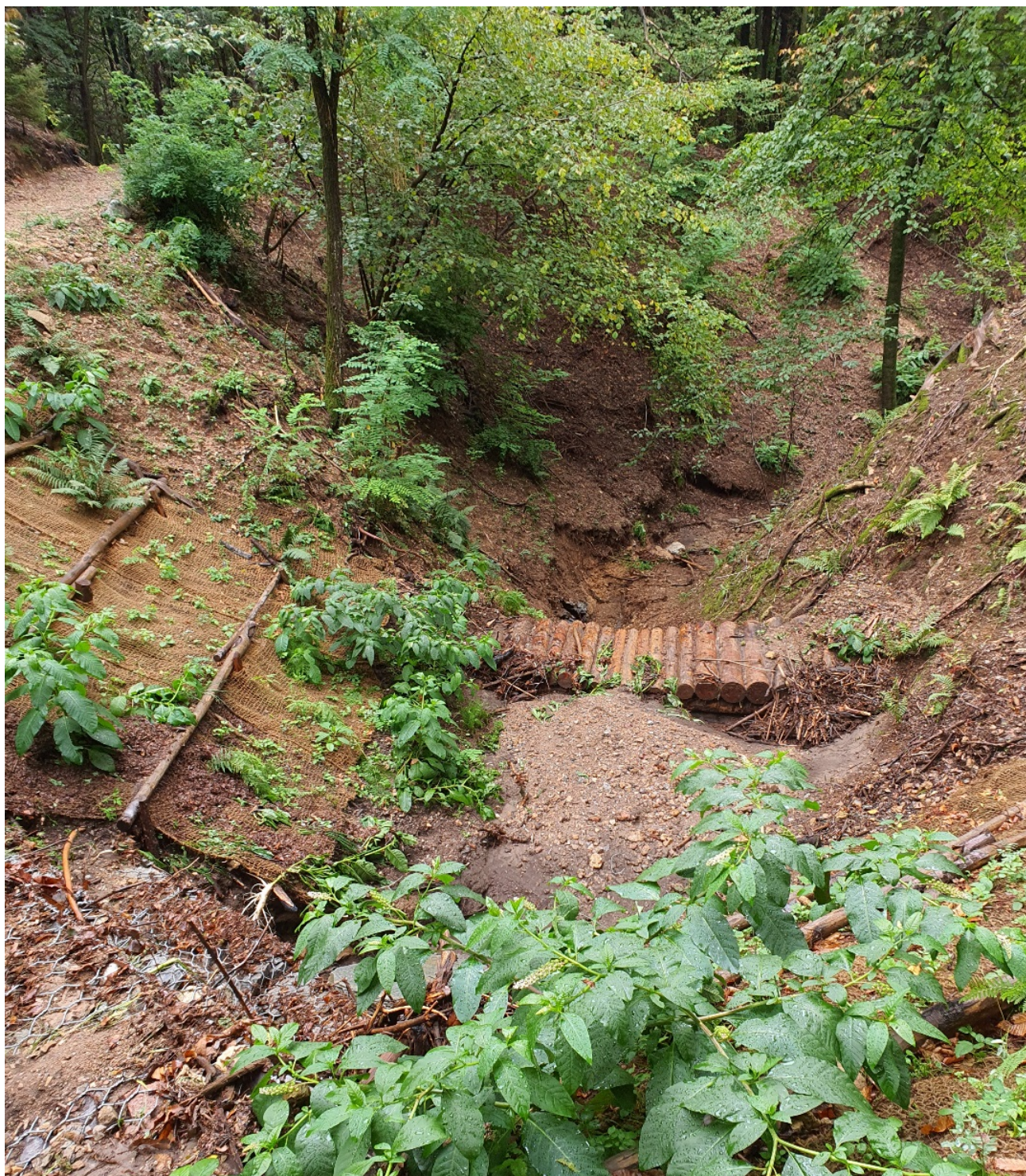
Foto 10 - Briglia e sistemazione di versante.

Nel comparto dovrà essere effettuato un monitoraggio con periodicità (semestrale), la dinamica geomorfologica dell'intera valle. Lo scopo del rilievo è la verifica della funzionalità delle opere trasversali (briglie), in termini sia di trattenuta di detriti sia di laminazione delle acque. Per l'area dovrà essere previsto anche un intervento di rigenerazione del bosco di protezione e di deviazione del flusso idraulico verso il bacino del Torrente Valle Luna.