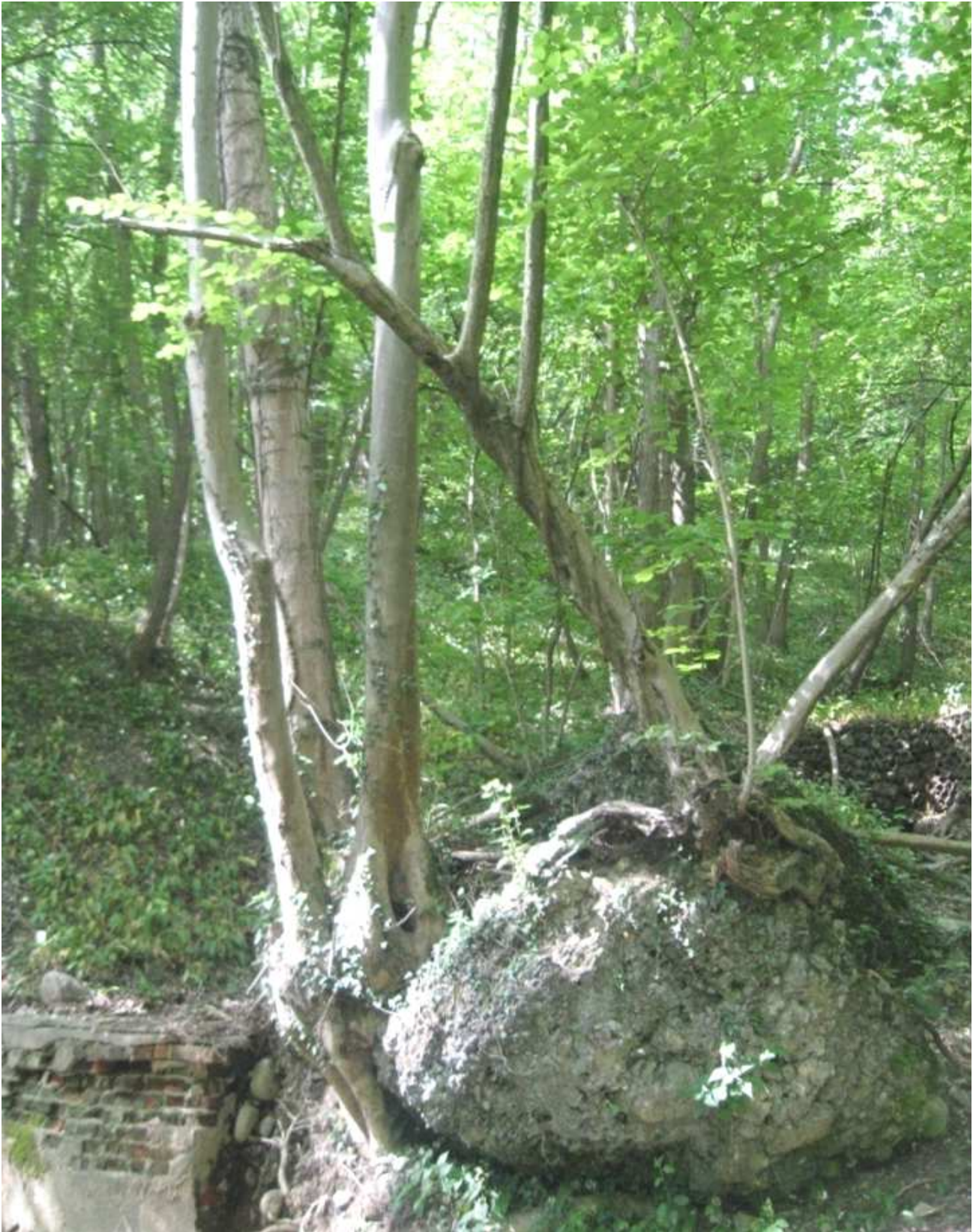
Foto 22 - Corpi conglomeratici caduti dalle pareti verticali, presenti in numero rilevante sul versante.