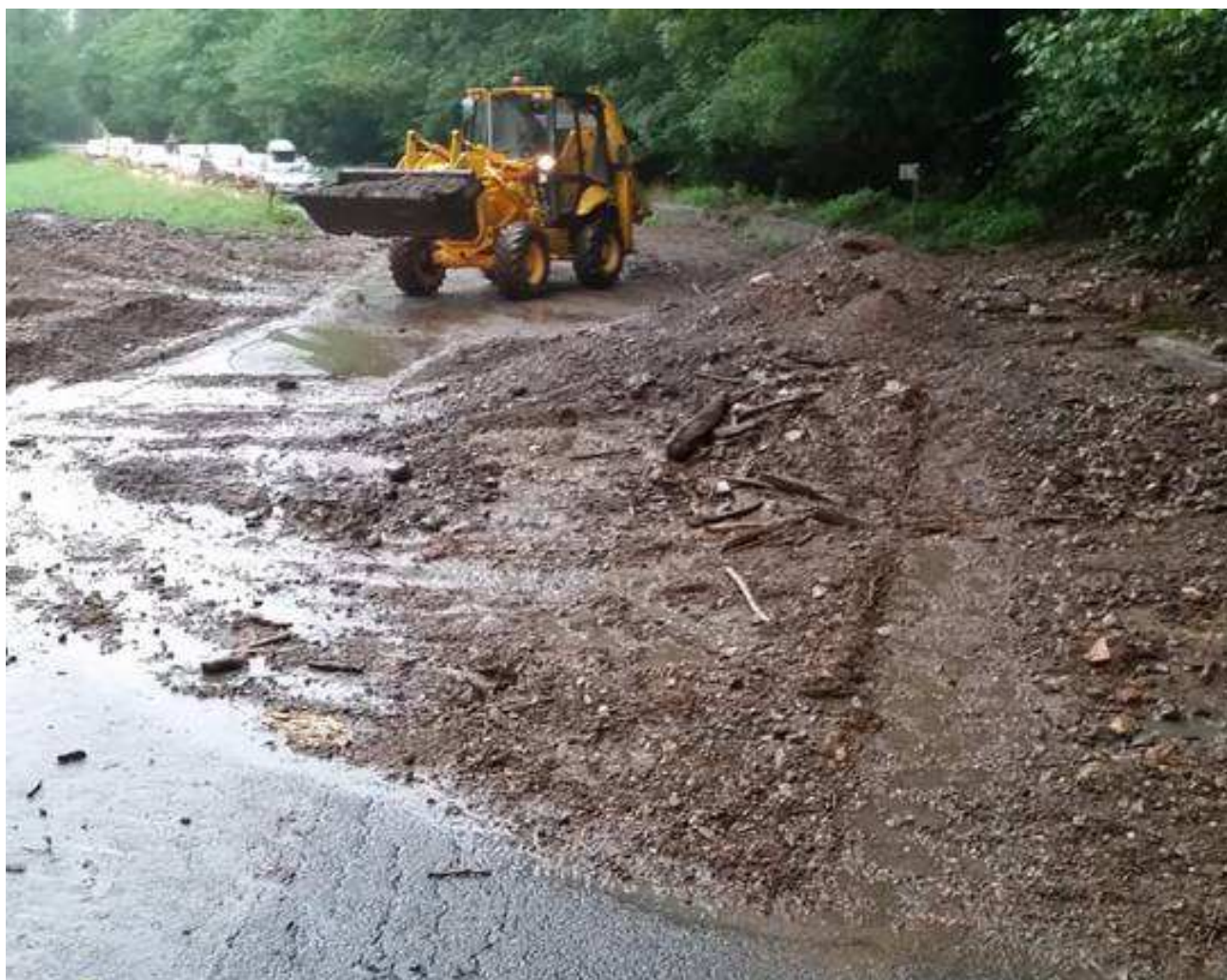
Foto 4 - Flusso detritico sul sedime stradale S.P. 62 Rasa (evento del 02/08/2019).

A seguito dell'evento sono stati realizzati alcuni interventi di riordino idrogeologico di versante, rincanalando le acque verso il torrente Galina. È necessario attuare nell'area interventi che possano garantire il completo riconvogliamento dei ruscellamenti concentrati nella Valle Galina. Dovrà essere verificato il tombotto sottopassante la Strada Provinciale 62 Rasa. Nell'anno 2021 nei giorni 08 , 13 e 24 Luglio, il fenomeno è accaduto nuovamente.