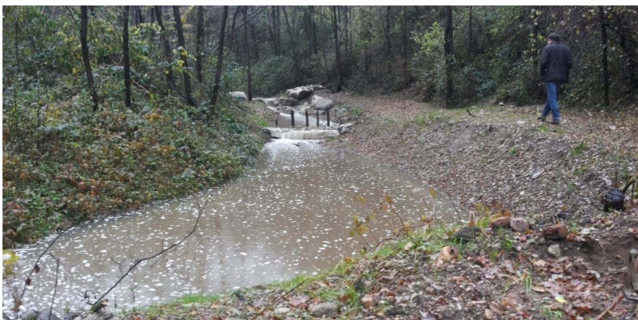
Foto 16 - Bacino di trattenuta detrito e di laminazione realizzato nell'anno 2014 a monte del tombotto sottopassante la via Monte Nero e via Peschiera.