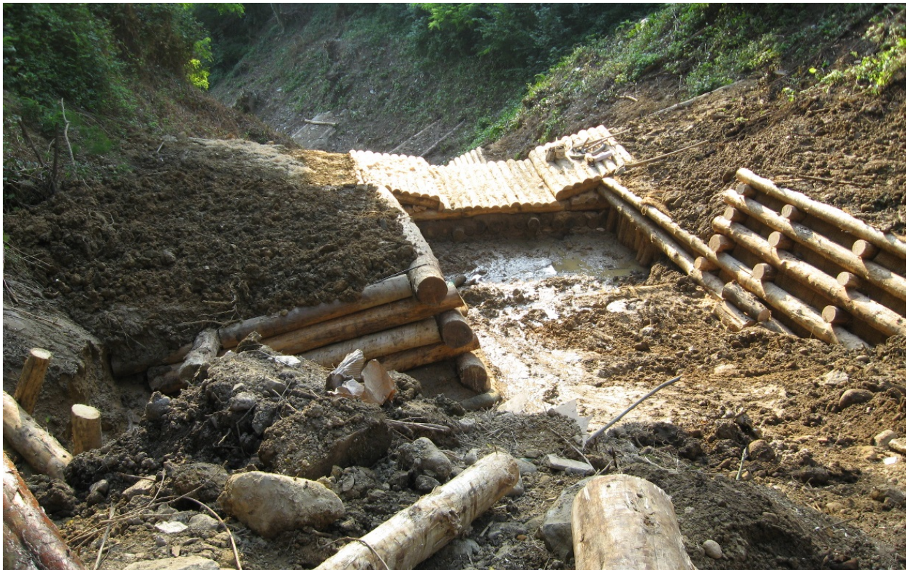
Foto 13 - Briglia realizzata nel Torrente Silvana per contenere i fenomeni di debris flow.