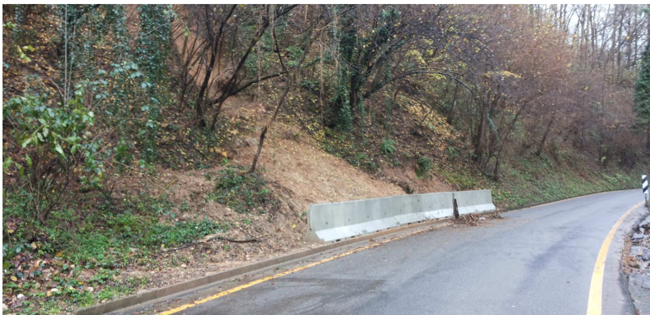
Foto 24 - Frana quiescente delimitata da new jersey di contenimento.

La via per Lozza, percorre un tratto di valle con versanti instabili caratterizzati da ruscellamenti concentrati provenienti dai pianalti sovrastanti. Questi episodi di ruscellamento concentrato portano sul sedime stradale notevoli quantità di materiali di trasporto detritico che rendono di fatto inagibile la strada. Un tratto di versante è soggetto a caduta massi. Il rischio idrogeologico del comparto è stato in parte risolto realizzando un fosso di guardia al termine dei pianalti che conducono le acque a valle del tratto stradale, realizzato a ridosso dei versanti e realizzando opere di presidio sul versante e lungo le tracce di ruscellamento, ormai ben definite. È necessario che venga fatta una regolare manutenzione del fosso di guardia (realizzato nel 2014) a monte del versante, che si realizzi una rete paramassi in aderenza sul tratto di versante soggetto a fenomeni di crollo massi e un nuovo canale soprastante la frana quiescente presente e contenuta con barriere stradali lungo la strada stessa.